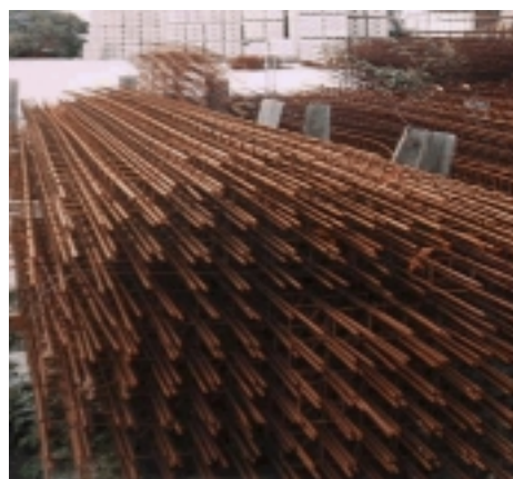
Longueurs de stock standard 6 ml